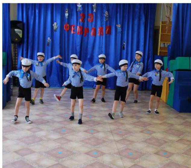
«Мещовские подсолнушки» №31