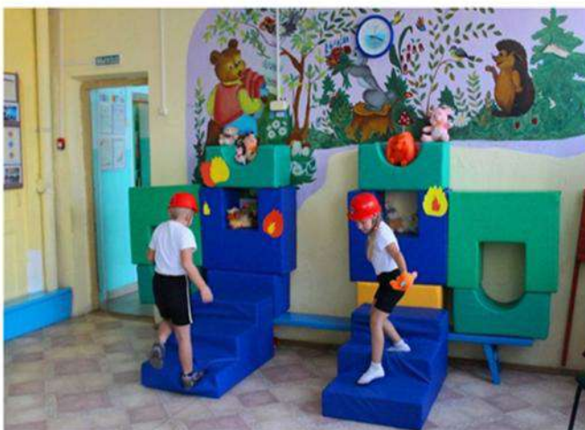
Спортивный праздник «Спасатели МЧС»