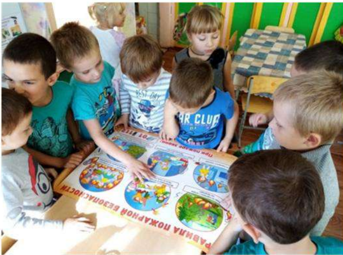
Знакомство с правилами пожарной безопасности