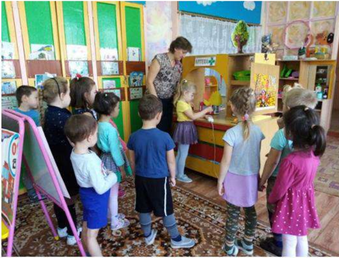
Учимся вызывать службу МЧС по телефону