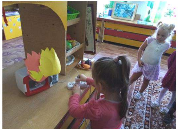
Обыгрывание действий при возникновении пожара