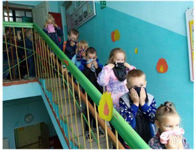
Тренировочная эвакуация при пожаре