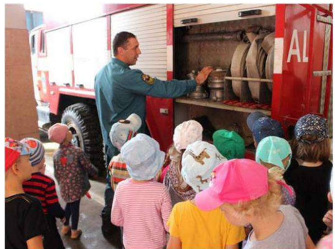
Экскурсия в ПЧ-19