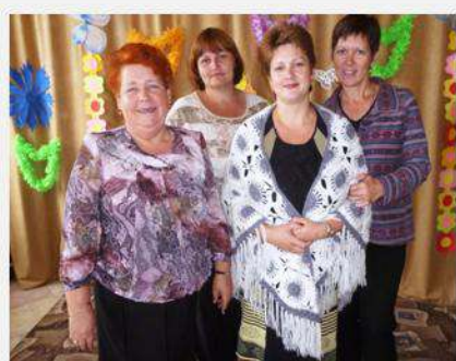
Творческая группа газеты «Мещовские подсолнушки»