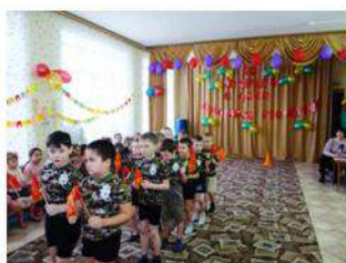
«Бравые солдаты вышли на парад»

В детском саду прошёл спортивный праздник «Бравые солдаты вышли на парад». А в конце месяца отмечалась Масленица: дети, подкрепились блинами, играли в разные игры и забавы, придумывали свои заклички.