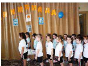
Вынос Олимпийского знамени.