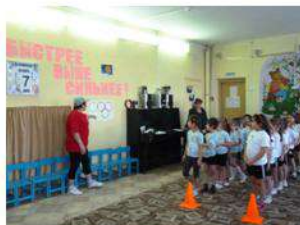
Спортник знакомит ребят с Олимпийскими символами.