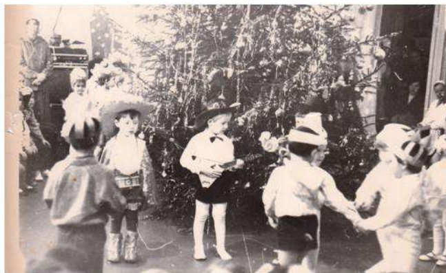
Всё тот же зал! И та же ёлка! (только деткам давно за 30 лет) 1985г.