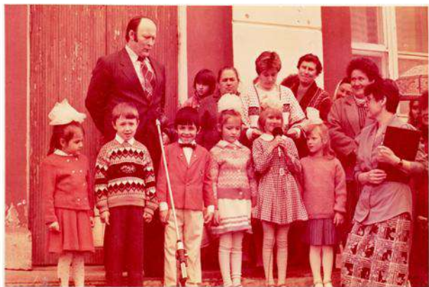
Непременные участники торжества воспитанники детского сада «Солнышко» 1993г.