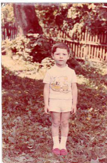
А старая яблоня ещё прино- сит плоды на радость де- тям. 1987г.