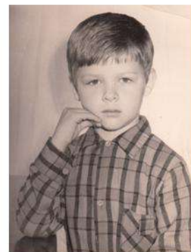
Такие фото на память делали в 1975 году для воспитанников дет- ского сада.