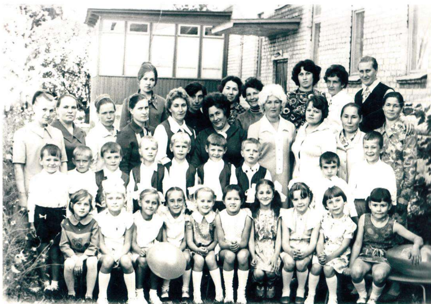
Выпускники 1977 года.