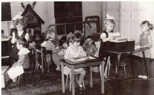
Мы играем. Декабрь 1985г.