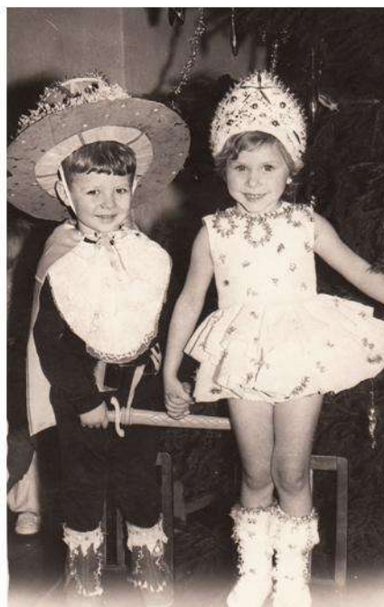
А костюмы - то самодельные!!! 1974г.