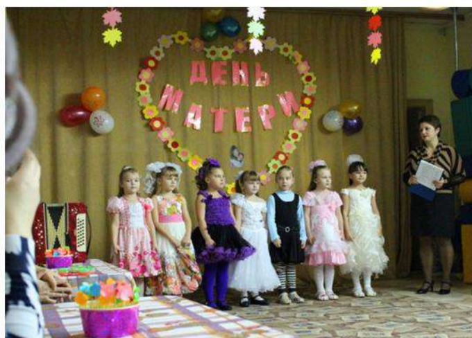
Песню про маму исполняют девочки подготовительной группы.