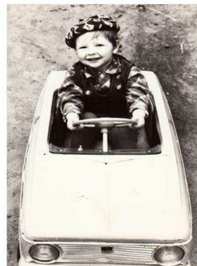
Крепче за баранку держись, шофёр. 1984г.