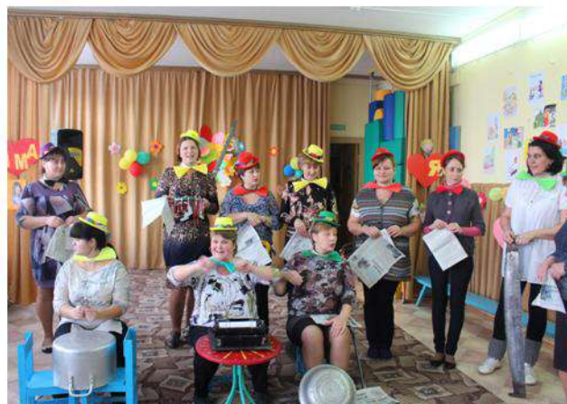
Праздничные и рабочие моменты встречи.