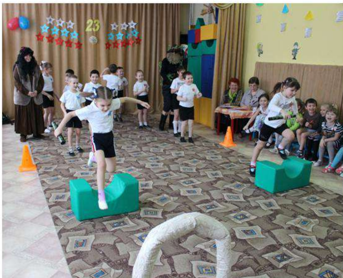
Соревнуемся 23 Февраля

Зимние месяцы богаты не только на праздники, утренники и развлечения, но и на конкурсы вне стен детского сада: традиционной встречей с папами, братьями и дедушками на 23 февраля, открытыми занятиями во всех возрастных группах.