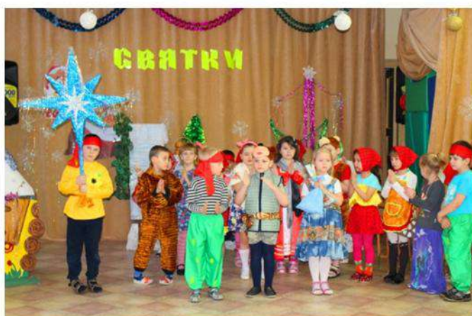
Уродилась коляда Накануне Рождества

Обычай славления Христа был детским. Один из детей нёс в руках звезду, которая символизировала Вифлеемскую звезду, а само шествие воспринималось как шествие волхвов. Войдя в дом, дети пели Рождественский тропарь, духовные стихи и величальные хозяевам. Ребятушек щедро одаривали. (из журнала «Музыкальный руководитель»)