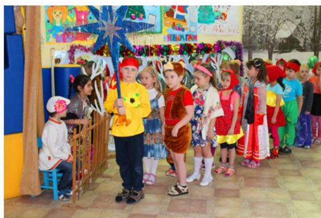
Открывайте окно, Запускайте Рождество!