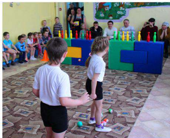
Делимся опытом (открытые занятия)