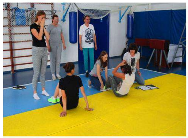
ГТО сдают воспитанники и педагоги Мещовского детского сада.