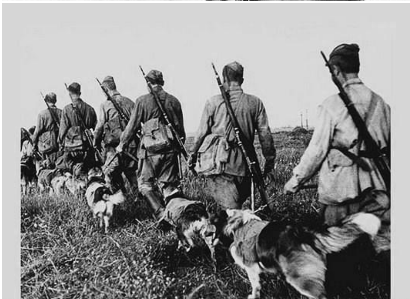
фото 1942 года . Фронтовые собаки -Бойцы со своими проводниками.