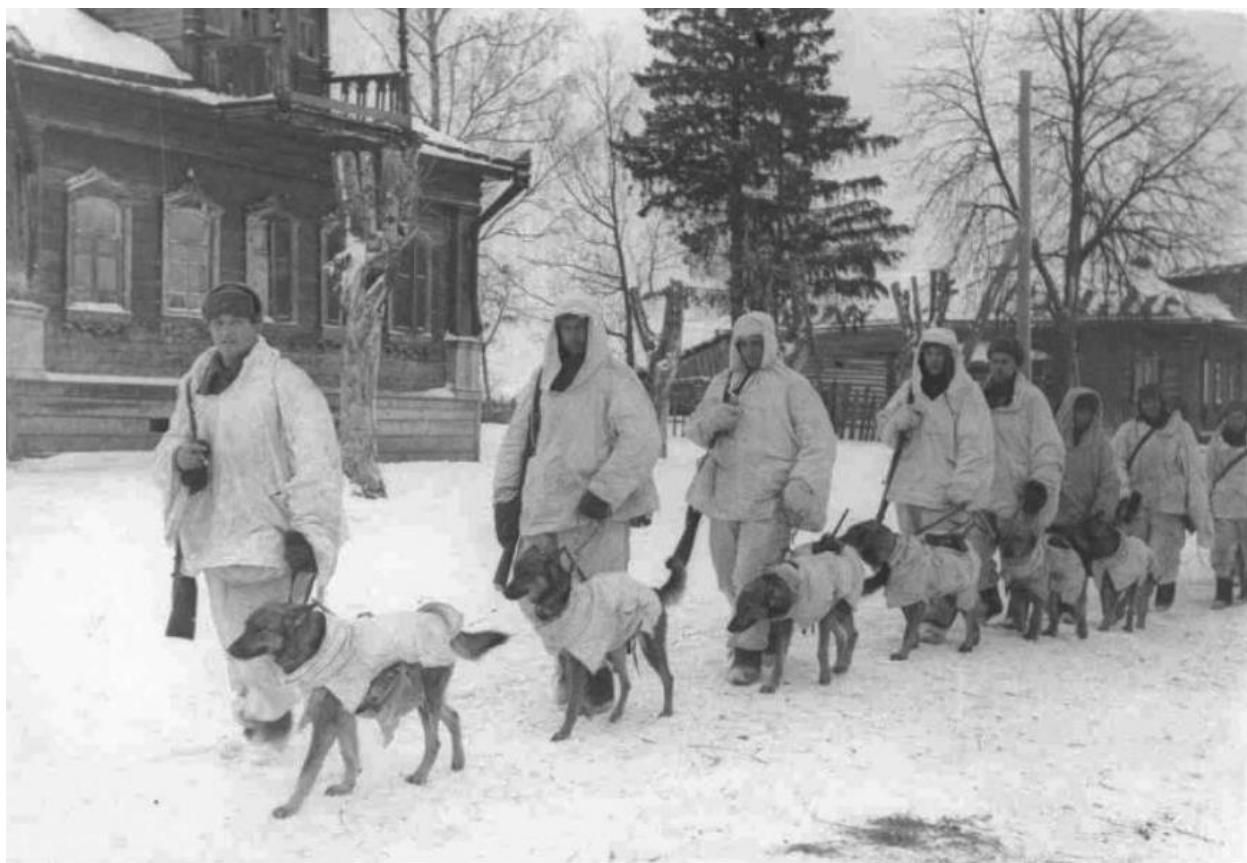
Собаки диверсионной службы занимались подрывом мостов и немецких поездов.