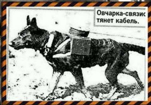
Овчарка-связист тянет кабель.